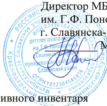
График обработки спортивного инвентаря